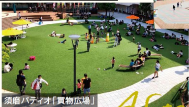
須磨パティオ「買物広場」