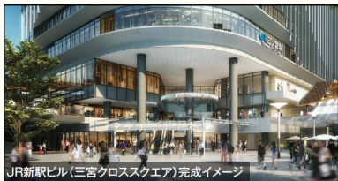
JR新駅ビル(三宮クロススクエア)完成イメージ

さんのみやえき まわり 三宮駅の周りに、電車やバスに乗るところを新しくします。まちの人も、遊び