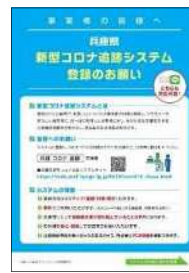
新型コロナ追跡システム 事業者向け登録依頼リーフレット