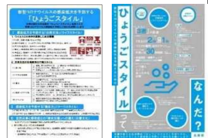
(※1)啓発チラシ (※2)啓発ポスター