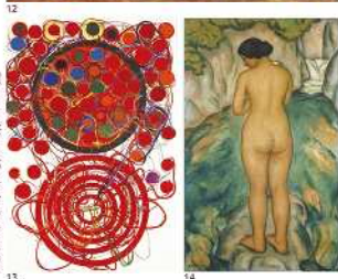
10. 高橋 由一《宮城県庁前門前図》1951年 11. 松本繁介《道二重（雪）》1966年 12. 洲之内徹《島》1942年 13. 松本繁介《オランダの村》1951年 14. 声量 展《具体美術協会》1957年