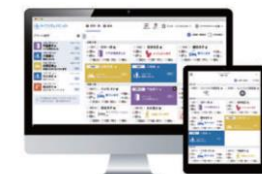
睡眠解析技術をベースにしたSaaS型高齢者施設見守りシステム(イメージ)