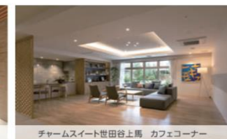
チャームスイート 世田谷上馬 カフェコーナー