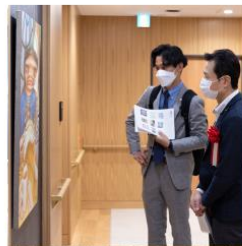
・関連企業 ・ギャラリー ・美術大学