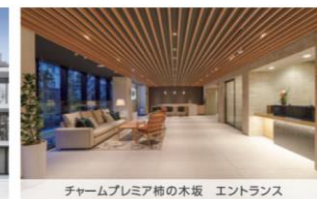
チャームプレミア 橋の木坂 エントランス