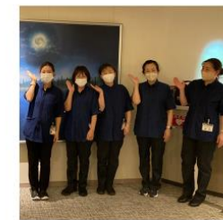
・家族 ・地域 ・スタッフ