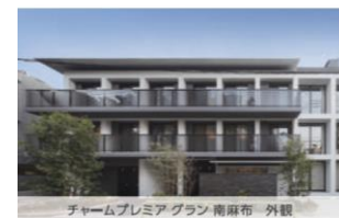
チャームプレミア グラン南麻布 外観

私たちは、これまで培ってきた高齢者向け住宅の建築・設計ノウハウをもとに、ご入居者様には自宅に限りなく近い「住まい」を提供することで、「より安心できる、快適な居住空間の創造」を実現してまいりました。今後も、開設するホームの地域のニーズや環境に合わせたフレキシブルな設計をおこない、「住み慣れた地域に住み続けたい」という想いをサポートしてまいります。