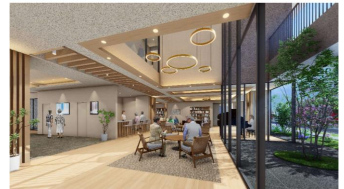
チャームプレミア甲南山手 内観イメージ