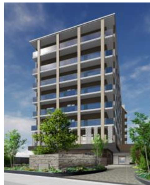
チャームスイート神戸垂水 建物外観

障がいの有無にかかわらず誰もが参加可能なワークショップを開催し、アートから生まれるコミュニケーションを生み出します。企画と進行は、アートコミュニケーター（東京都美術館と東京藝術大学の連携事業「とびらプロジェクト」より輩出）が行います。