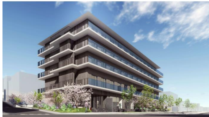
チャームプレミア甲南山手 建物外観