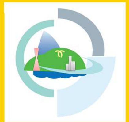
神戸市優良工事認定ロゴマーク