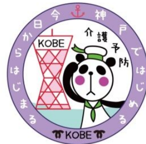
神戸市介護予防マーク