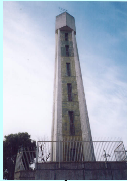
■基幹事業 公営住宅等整備 市営栄住宅(給水施設改善)