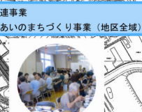
○関連事業 ふれあいのまちづくり事業(地区全域)