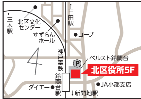
北区役所5階 【北区鈴蘭台北町1-9-1】