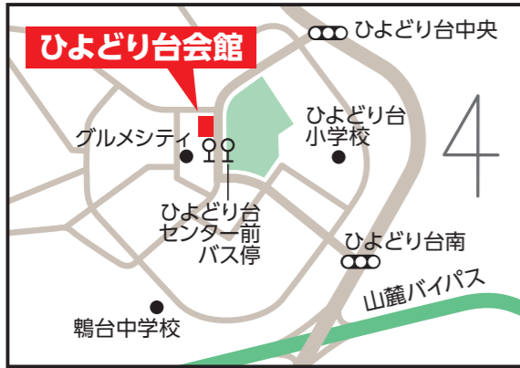
ひよどり台会館 【北区ひよどり台2-1-1】