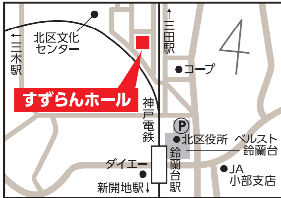
すずらんホール 【北区鈴蘭台西町1-26-1】