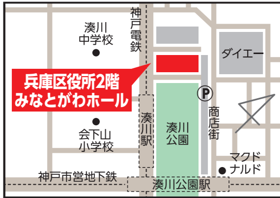
兵庫区役所2階みなとがわホール 【兵庫区荒田町1-21】